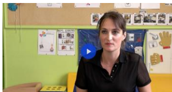
L'autonomie en maternelle