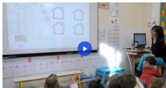
Les fonctions exécutives en maternelle