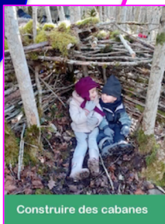
Construire des cabanes